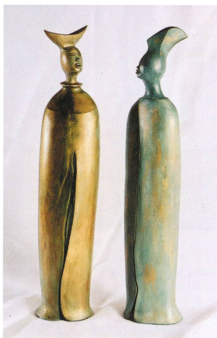
Fig. 12a et 12b – Grands êtres.