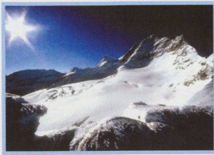
Aspects of Geneva Photometry - 4