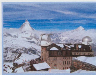
ETH Zürich entwickelt bahnbrechendes, digitales FFT-Radiospektrometer - 21