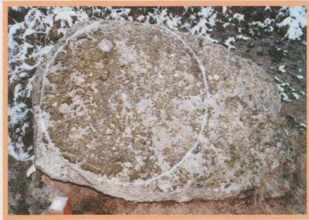
Die Kalenderscheibe von Nebra - 4