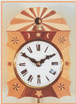
Eine astronomische Monduhr zu einem alten Uhrwerk - 14