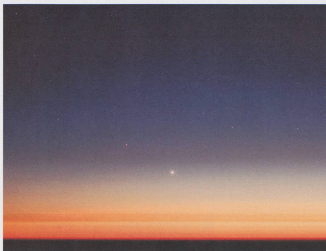
Saturne, Vénus, Mercure, les étoiles Castor et Pollux ainsi que l'amas de Praesepe (en haut à droite) apparaissent dans le crépuscule. Photo prise depuis l'Observatoire de Roque de los Muchachos, île de La Palma, Canaries, le 22 juin 2005 à 23h26m TU. Pose de 10 sec avec 50 mm à f:1.4 diaphragmé à 2.5.