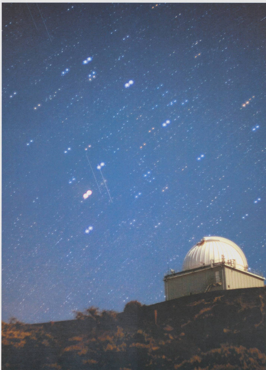
Superposition de deux photos consécutives montrant deux «satellites» qui se déplacent parallèlement! Deux poses de 20 sec initiées le 13 juin 2005 à 22h 21m 19s TU et 22h 22m 41s TU, respectivement (horloge de l'appareil photo: \pm 1m! ), île de La Palma, Canaries.

Qui a une suggestion concernant l'identification de ces objets?