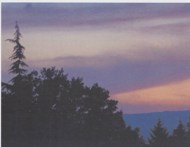
La conjonction de Vénus et Mercure du 27 juin 2005 à 20h 21m TU. Captée malgré les conditions de visibilité à Genève – moins bonnes qu'aux îles Canaries! Pose de 1/6 sec à pleine ouverture avec objectif de 85 mm f:1.4.