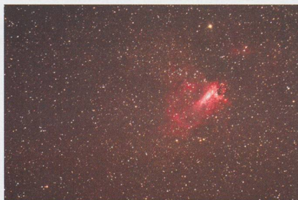
M17: 6 x 1min