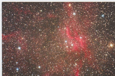
X nebula (DWB111): 6 x 10min