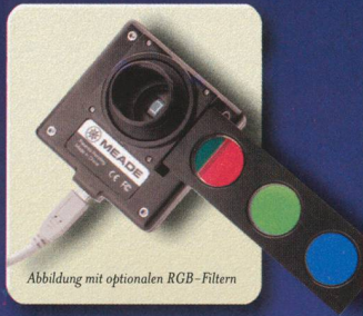
Abbildung mit optionalen RGB-Filtern