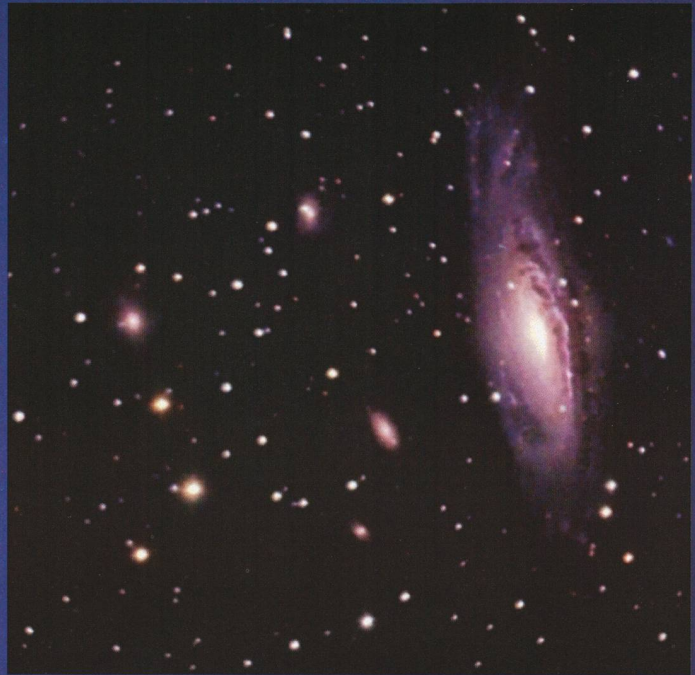
Spiral-Galaxie NGC 7331 mit Nachbargalaxien im Sternbild Pegasus. mit dem DSI PRO am 10" LX200 bei f/4. LUM 140min, RGB jeweils 50min pro Kanal.

*Unverbindliche Preisempfehlung in Euro (D).