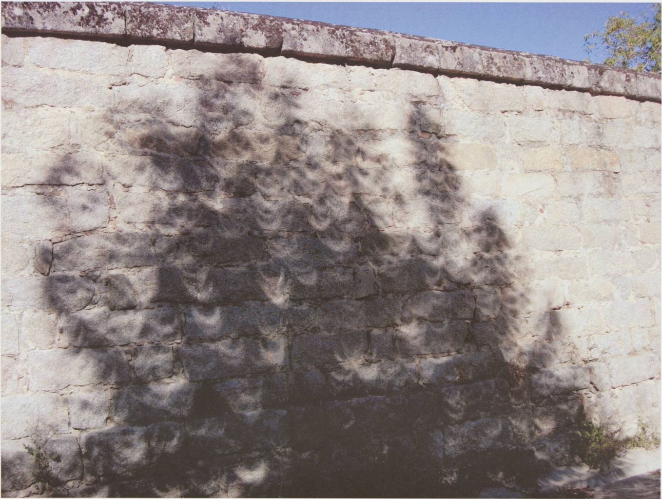
Ombres lors de l'éclipse de Soleil du 3 octobre 2005 à San Lorenzo de El Escorial.