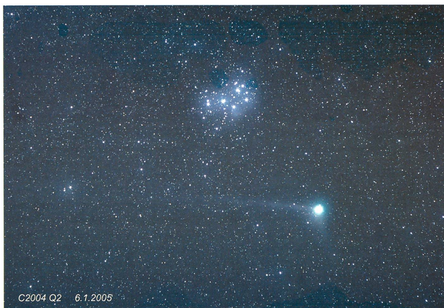
Nikon D70 1600 ASA, lunette Orion 80. Temps de pose: 5 min. Aufnahme mit Nikon D70, 1600 ASA, Fernrohr: Orion 80. Belichtung: 5 Min.

A partir de ce moment-là, ce ne sont pas moins de 200 jours par an qui sont consacrés aux visites, et plus de 3000 personnes se rendent chaque année à l'obser-