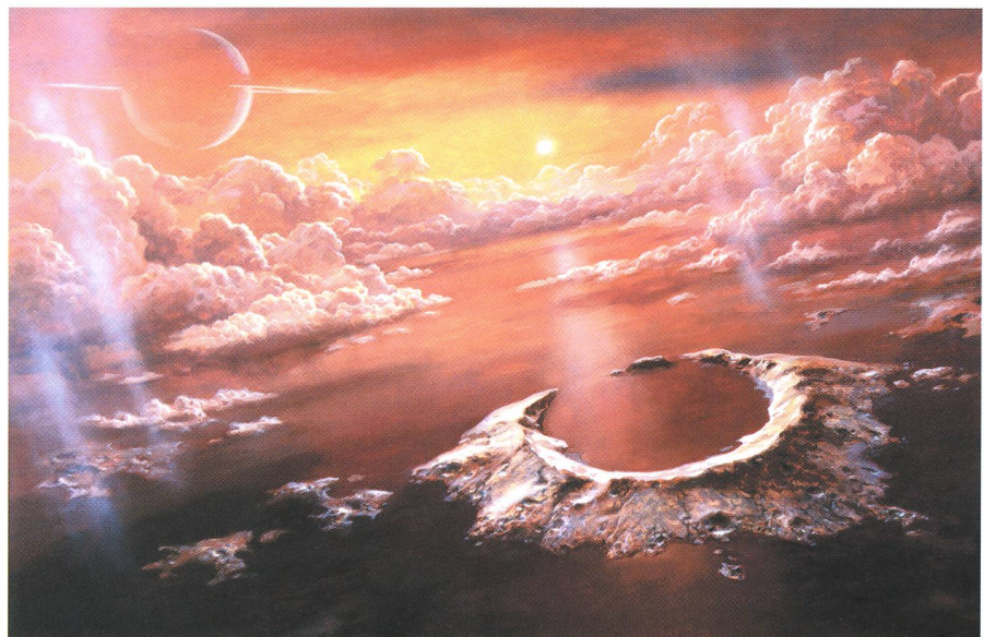
Fig. 7. Die Oberfläche des Saturnmondes Titan (1992)

Die beiden Viking-Marssonden der NASA, die 1976 auf dem Mars landeten, bestätigten dann LUDEK PESEKS «Ansichten». Die Aufgabe, verschiedene Ansichten und Landschaften vom Mars zu malen, nahm ihn so gefangen, dass er «mehrere Monate auf dem Mars [lebte]...» 15 – wie er sein damaliges Lebensgefühl beschreibt.