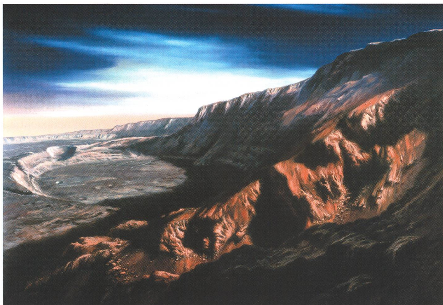
Fig. 3. Mars – in der Caldera von Olympus Mons

den Fotos verglich, die Astronauten von der Mondoberfläche machten [am 21. Juli 1969 landeten die ersten Menschen auf dem Mond], brauchte ich mich nicht zu schämen.» 7 Diese Äusserung zeigt, dass es LUDEK PESEK in der Weltraummalerie um eine möglichst realistische Darstellung, nicht um Phantastereien geht. Seine Genialität als Maler besteht in der Fähigkeit, seine reiche Vorstellungskraft mit den verfügbaren wissenschaftlichen Erkenntnissen zu einer «realistischen Vision» zu verbinden.