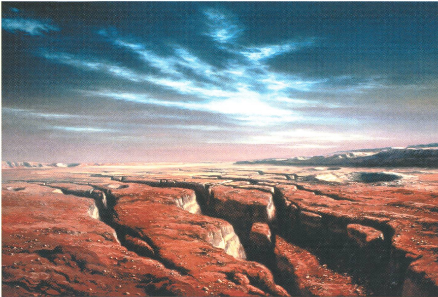
Fig. 5. Mars 21

hington D.C. als Illustrator der Entdeckungen, die die Raumsonden der NASA in den späten 1960er und in den 1970er Jahren machten.