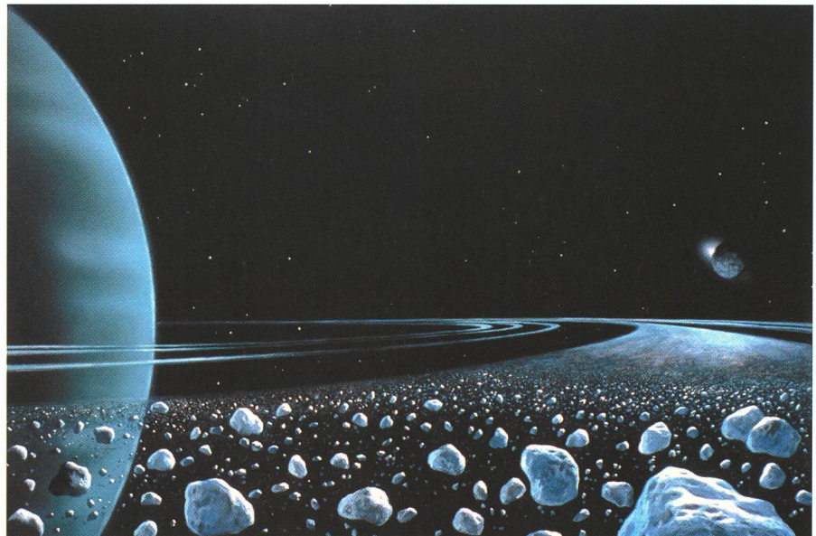
Fig. 6. In den Uranus - Ringen

In der ausweglosen Situation, als die kommunistische Regierung ihm alle Möglichkeiten nahm, sich als Maler, Fotograf oder Schriftsteller seinen Lebensunterhalt zu verdienen, malte er für sich selbst eine Reihe von Mondlandschaften. In diesen Bildern konnte LUDEK PESEK seine Kindheits- und Jugendträume von fernen, unbekanntem Landschaften ausleben und der Misere seiner Situation als Künstler in der CSSR entfliehen. Er schuf sich so einen «Freiraum». Wie er selbst sagte, begann damals seine Auswanderung – zuerst auf den Mond, später folgte die tatsächliche in die Schweiz. 6 Der Mond wurde zunächst sein Hauptthema. Er vertiefte sich in astronomische Studien, um seine Kenntnisse zu erweitern und zu vertiefen. Er selbst sagt über diese Zeit: «Im Jahre 1960 diskutierten die Wissenschaftler immer, wie die Oberfläche des Planeten sein könne: Staub, Lava, hunderte tiefer Spuren? Ich entwarf während dieses Meinungschaos' meine Mondlandschaft im Jahre 1961. Als ich meine Bilder mit