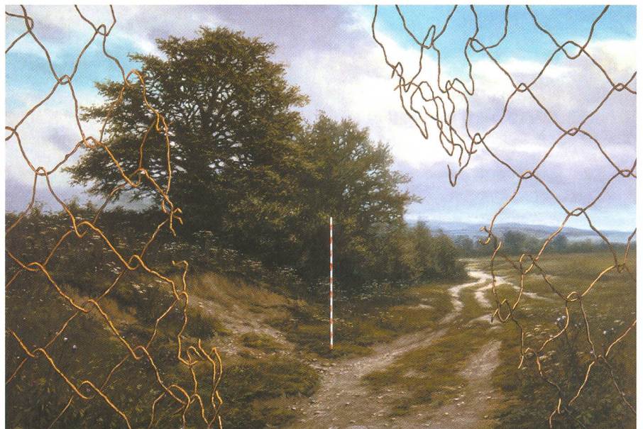
Fig. 1. Freiheit

Wie in einer Nahaufnahme rückt der Maler einen kleinen, aber zentralen Ausschnitt von einem Holztor vor das Auge des Betrachters. Dieser steht – ähnlich wie bei dem Gemälde mit dem Titel Freiheit – unmittelbar davor; ein Kontext, in den er das Tor einordnen könnte, ist durch die Wahl der Perspektive