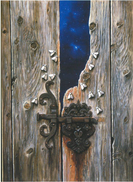
Fig. 2. Die Motten

nicht gegeben. Ganz detailgetreu sind Struktur und Farbe des verwitterten Holzes wiedergegeben, ebenso liebevoll genau gemalt ist ein kunstvoll gearbeitetes, verrostetes Schloss, das die beiden Flügel gerade noch zusammenhält. Aufgrund der meisterhaft realistischen Maltechnik ist hier die Achtung des Malers vor den Dingen und ihrem Eigenleben, aber auch die vor der handwerklichen Kunst des Schlossers fast mit den Händen zu greifen. Die rostrote Spur, die der Regen unterhalb des rechten Schlosselements hinterlassen hat, legt die Assoziation an eine blutende Wunde nahe. Oberhalb des Schlosses ist Holz bereits weg gebrochen und die so entstandene Öffnung gibt den Blick frei auf den tiefblauen Himmel, in dem die Sterne funkeln. Die Vergänglichkeit der irdischen Dinge – symbolisiert durch den Rost und das ausgebleichte Holz – kontrastiert mit der faszinierenden Tiefe des Universums. Man gewinnt den Eindruck, dass unsere Welt eine absterbende sei, dass es gilt, neue Welten jenseits unserer alten Erde zu entdecken.