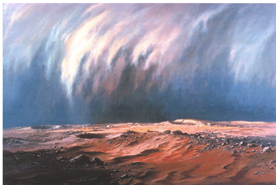
Fig. 4. Mars - Staubsturm

Mit seinen Illustrationen in The Moon and the Planets erregte LUDEK PESEK Aufmerksamkeit in Fachkreisen. Begeistert von seinen Bildern 10 wandte sich die National Geographic Society in Washington D.C. über den Artia Verlag an LUDEK PESEK – mit der Bitte um Zusammenarbeit. Dieses Angebot eröffnete ihm eine neue berufliche Perspektive und erleichterte den Neuanfang in der Schweiz. Für viele Jahre sollte nun der Weltraum sein malerisches und literarisches Thema werden, der Jugendtraum, «(s)eine Begeisterung für ausserirdische Landschaften» 11 wurde zu seinem Beruf. Von 1969 bis 1986 arbeitete er für das National Geographic Magazine und die Smithsonian Institution – National Air and Space Museum in Was-