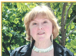
Les Potins d'Uranie: Etreinte Céleste - 30