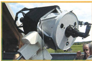
Generalversammlung der SAG Assemblée générale de la SAS - 16