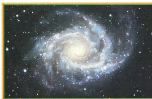
Les Potins d'Uranie: Le «truc d'Ernest» - 26