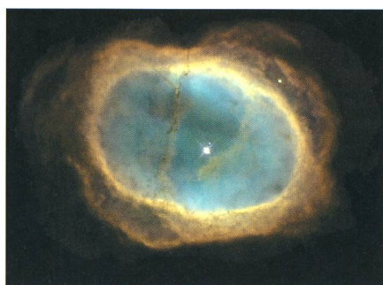
La nébuleuse planétaire NGC3132, située à la limite de la constellation des Voiles (Vela), ressemble à la célèbre nébuleuse M57 de la Lyre.

tions d'étoiles mentionnées ci-dessus, il fut le premier à mesurer un arc de méridien africain. Il détermina aussi les parallaxes lunaire et solaire, établit une table d'éclipses pour 1800 ans, etc. Lacaille dit de lui que, dans sa vie plutôt courte, Lacaille fit plus d'observations et de calculs que tous les astronomes de son temps réunis.