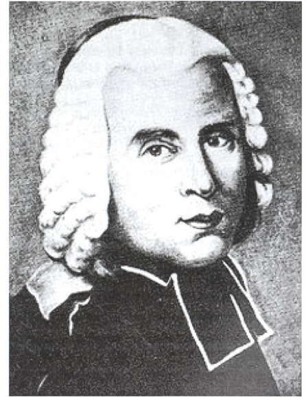
L'abbé Nicolas-Louis de Lacaille. (1713-1762)

Comme l'avaient bien compris les paysans du village des hauts-plateaux, la Machine Pneumatique 1 est une modeste constellation de l'hémisphère Sud.