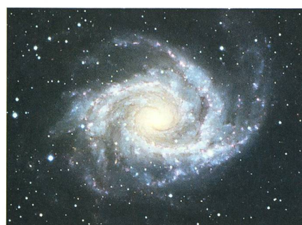
La galaxie spirale NGC2997 est également une radiogalaxie.

Comme déjà expliqué en ces pages 3 , les limites des constellations furent définitivement fixées en 1930 par E. Delporte pour le compte de l'Union Astronomique Internationale (UAI). Dans l'opération, les étoiles \beta et \gamma Ant (deuxième et troisième en brillance de la Machine Pneumatique ) passèrent définitivement dans les constellations voisines. L'étoile principale, \alpha Ant, est