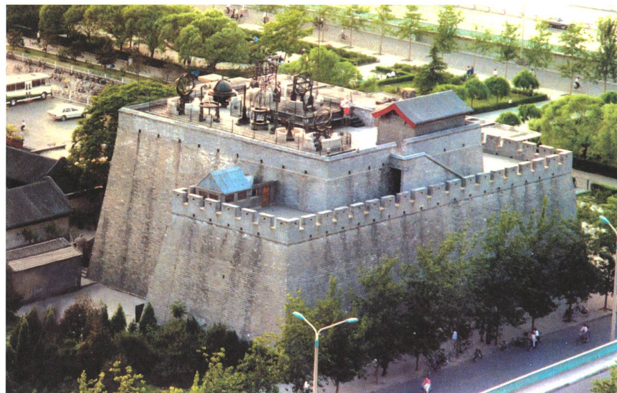
Fig. 2: Vue aérienne montrant l'agencement des différents instruments en cuivre, la plupart construits en 1673 et conservés sur la plateforme. Aux heures d'ouverture, celle-ci est envahie par les visiteurs. Le bâtiment comprend différentes salles comme le «Hall d'Observation des Ombres».

En été, la température et la moiteur étaient telles que les documents portés sur soi devaient être protégés par du plastique. Même les Pékinois transpiraient abondamment dans de telles con-