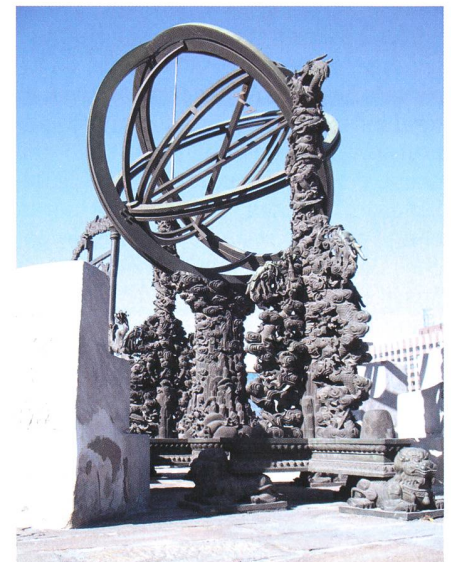
Fig. 6: Cette autre sphère armillaire est nettement plus jeune (1744).

L'astronomie chinoise est millénaire et son historique sort du cadre de cette courte note. Le premier observatoire pékinois aurait été fondé par les Jing après la chute de la dynastie Song en 1227. Ils y auraient amené des instruments depuis Kaifeng. Le second observatoire fut édifié en 1279 par les envahisseurs mongols (Kublai Khan), un peu au nord de l'emplacement actuel. Les Ming succédant aux Mongols, ZHU YUANZHANG, le fondateur de la dynastie, transféra les instruments à Nanjing. Lorsque l'empereur Yongle (1403-1424), le troisième de la dynastie Ming, usurpa le trône de son neveu, il n'osa