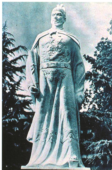
Fig. 9: Statue de l'amiral ZHENG HE (1371-1433) sur la rive sud du fleuve Min au Fujian. C'était un des points de départ de sa flotte impressionnante qu'il conduisit jusqu'au Golfe Persique et la côte Est de l'Afrique (voir texte).

Rappelons brièvement que CHRISTOPHE COLOMB ne partit que beaucoup plus tard (1492) à la recherche des Indes Occidentales, pour le compte des Rois Catholiques d'Espagne et à la tête de ce qui paraît être en comparaison trois esquifs – ses bateaux ne faisant pas 30m de long