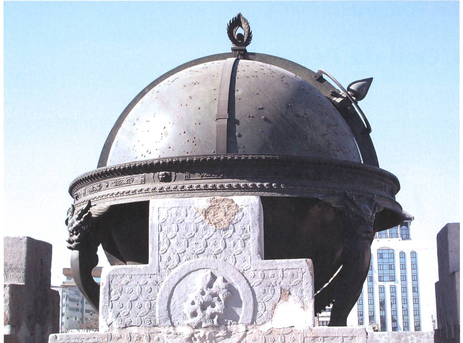
Fig. 4: Globe céleste (1673).

La date exacte de la fondation de l'Ancien Observatoire de Beijing semble sujette à légère controverse. La documentation distribuée par le musée situe la construction en 1442 de notre ère, tandis que d'autres sources la font remonter à 1422 3 . Cet observatoire pré-télescopique fut édifié sur un mur de la ville sous le règne de Zhengtong de la dynastie Ming. Les Qing le dotèrent ensuite d'instruments ornés de décorations chinoises traditionnelles, mais incorporant les réels progrès de l'époque en termes de graduations, de verniers, etc. Ils sont devenus une collection unique au monde.