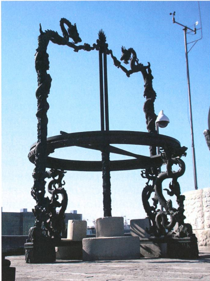
Fig. 3: Altazimuth (1673). (cliché Al Nath)

ditions et les parapluies, ombrelles et éventails en tous genres étaient alors de sortie.