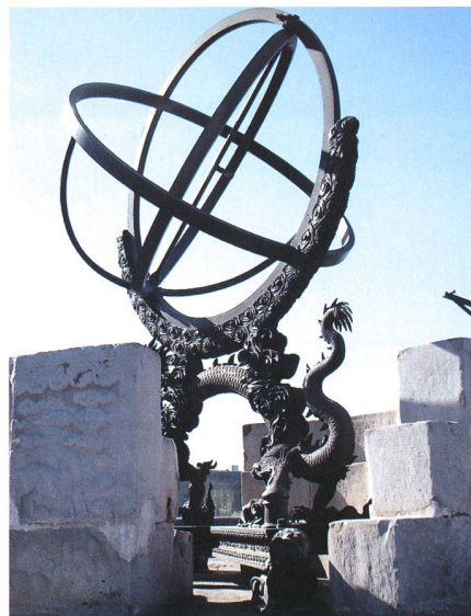
Fig. 5: Sphère armillaire (1673).

L'astronomie chinoise est millénaire et son historique sort du cadre de cette courte note. Le premier observatoire pékinois aurait été fondé par les Jing après la chute de la dynastie Song en 1227. Ils y auraient amené des instruments depuis Kaifeng. Le second observatoire fut édifié en 1279 par les envahisseurs mongols (Kublai Khan), un peu au nord de l'emplacement actuel. Les Ming succédant aux Mongols, ZHU YUANZHANG, le fondateur de la dynastie, transféra les instruments à Nanjing. Lorsque l'empereur Yongle (1403-1424), le troisième de la dynastie Ming, usurpa le trône de son neveu, il n'osa