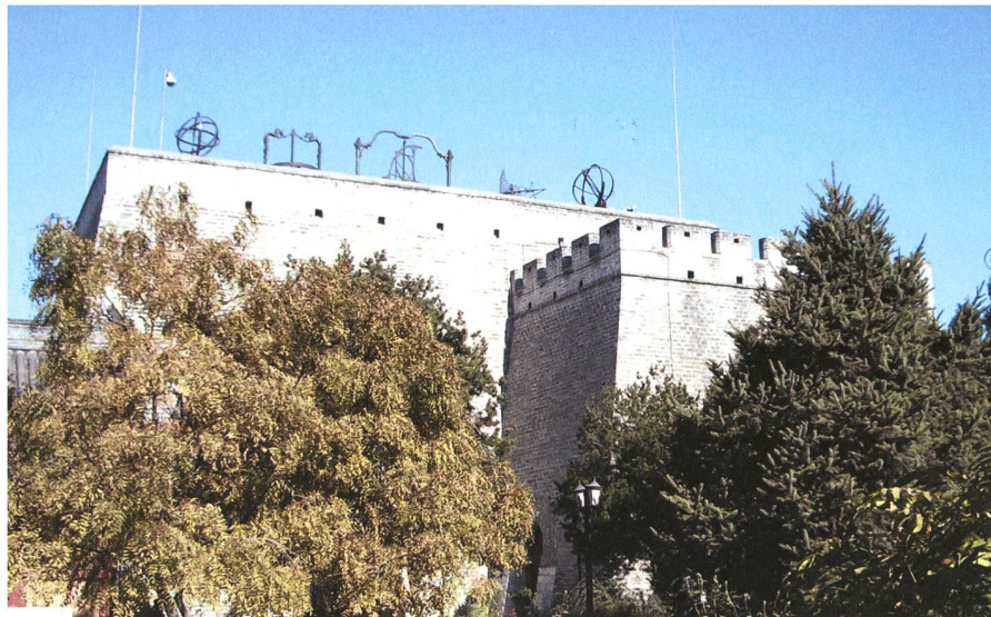
Fig. 1: Vue de l'Ancien Observatoire de Beijing construit vers la moitié du 15 e siècle sur une muraille de la ville (14m de haut). Il fut rendu accessible au public en 1956.

Était-ce du aux quelques jours qu'il venait de passer en mer? JIM McCULLOGH était fasciné par le charme émanant des deux chinoises, superbes dans leur qi pau , la longue robe classique largement fendue sur les côtés. Ignorant les commentaires provocateurs d'un groupe de leurs congénères à l'autre bout du restaurant, elles dînaient tranquillement avec grâce. Jim ne s'y trompait pas: il s'agissait là de deux éléments de la génération moderne de femmes chinoises, racées, instruites, investies de responsabilités dans un pays se transformant à un rythme soutenu.