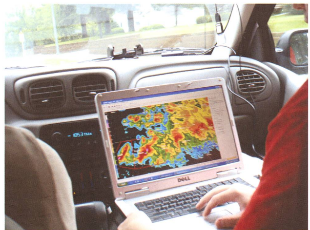
Le navigateur consulte en permanence les cartes et bulletins météo pour connaître l'évolution des supercellules et se positionner dans la zone la plus favorable en cas de tornade.

Départ pour le Kansas, car c'est là, ainsi que dans l'Oklahoma, et le Nord Texas, que les risques de tornades ou, pour nous, les chances d'en voir sont les meilleures. Chaque matin, nos 2 météorologues consultent les différents bulletins et programmes spécifiques pour connaître, avec le plus de précision possible, les zones où les probabilités de formation de supercellules sont les meilleures. Parmi les différents types d'orages, les « supercellules » sont ceux qui génèrent des rafales de vents d'une extrême violence, et forment des grêlons énormes et des tornades dévastatrices et, hélas, parfois meurtrières. Comme par hasard, elles se