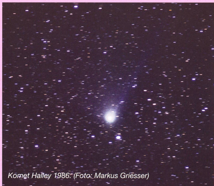
Comète Halley 1986.

P/2008 Q2 (Ory) repassera près de la Terre en 2014. Elle recevra à cette occasion un numéro d'ordre, le cinquième jamais assigné à une comète helvétique. (mo)