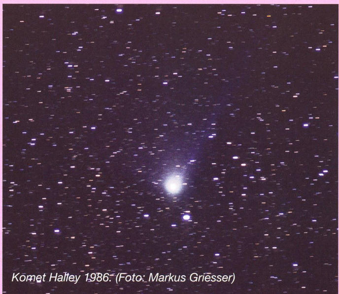
Comète Halley 1986.

P/2008 Q2 (Ory) repassera près de la Terre en 2014. Elle recevra à cette occasion un numéro d'ordre, le cinquième jamais assigné à une comète helvétique. (mo)