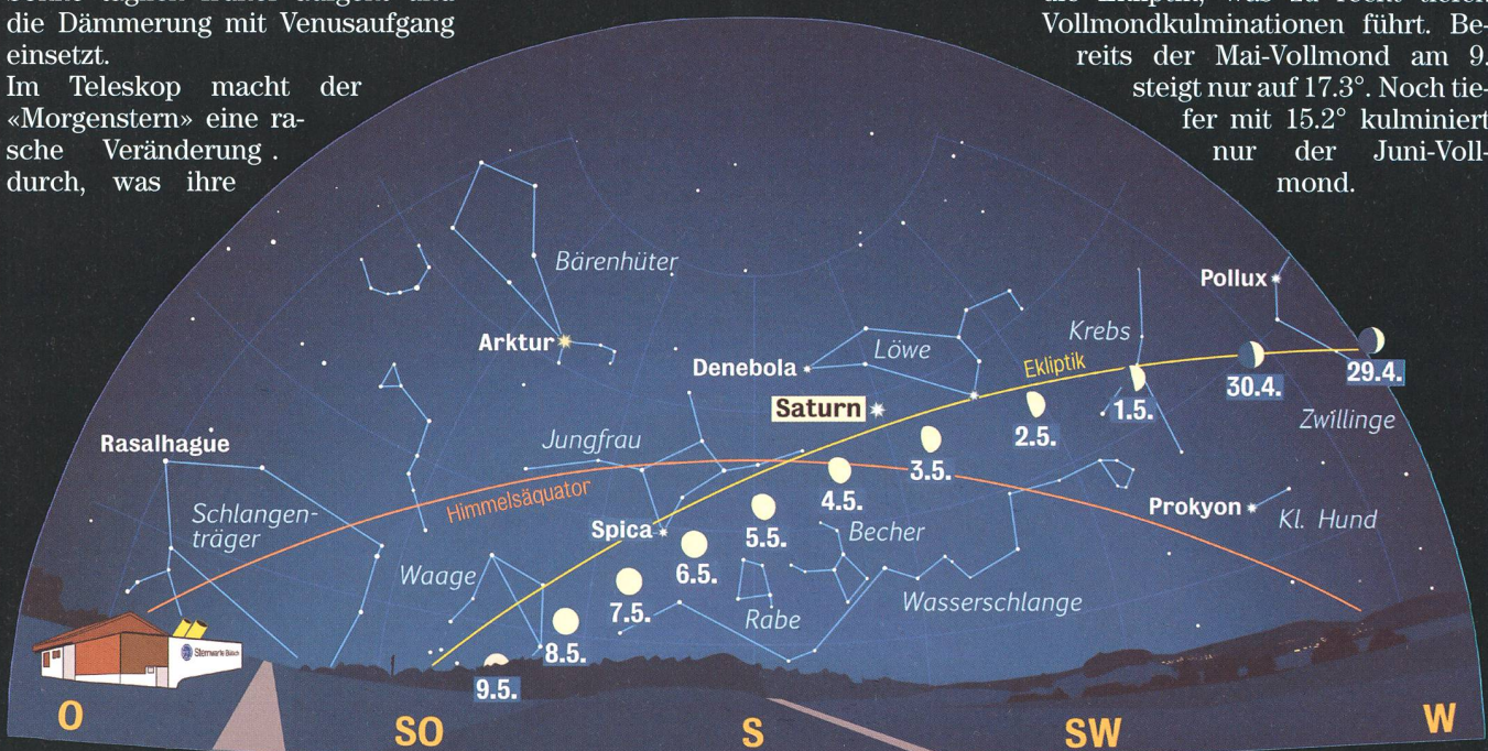
Anblick des abendlichen Sternenhimmels Mai 2009 gegen 22.15 Uhr MESZ (Standort: Sternwarte Bülach)

Die Ekliptik (scheinbare jährliche Sonnenbahn) kreuzt den Himmelsäquator im Herbstpunkt im Sternbild Jungfrau unter 23,5°. Im Frühjahr verläuft die Ekliptik von Nordwesten nach Südosten. Die Mondbahn seinerseits ist gegenüber der Ekliptik um weitere 5,2° geneigt. Der absteigende Mondknoten befindet sich 2009 im Grenzgebiet zwischen Stier und Zwillinge. So taucht auch dieses Jahr der Mond im Sommer unter die Ekliptik, was zu recht tiefen Vollmondkulminationen führt. Bereits der Mai-Vollmond am 9. steigt nur auf 17,3°. Noch tiefer mit 15,2° kulminiert nur der Juni-Vollmond.