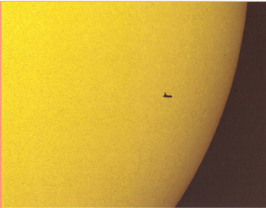
Diese spektakuläre Aufnahme der Silhouette des Space Shuttle Atlantis vor der Sonnenscheibe gelang Thierry Legault am 12. Mai 2009 von Florida aus.