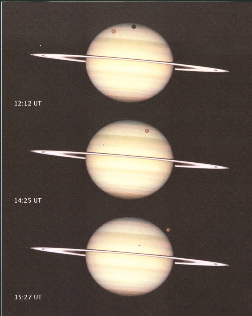
Am 24. Februar 2009 warf von 11:49 Uhr bis 14:22 Uhr MEZ Titan seinen Schatten auf die Saturnkugel, ab 14:51 Uhr MEZ (deutlich im mittleren Bild zu sehen) liefen auch die Schatten von Dione und ab 15:19 Uhr MEZ derjenige von Enceladus über den Ringplaneten.

Wie beschrieben, rückt die Sonne aber immer näher zum Planeten auf; die Untergänge Saturns erfolgen stets knapper nach Sonnenuntergang. Taucht er am 1. August noch anderthalb Stunden nach der Sonne im Nordwesten unter, sind es am 10. schon eine ganze Viertelstunde weniger; am 20. sinkt die theoretische Sichtbarkeit sogar unter eine Stunde.