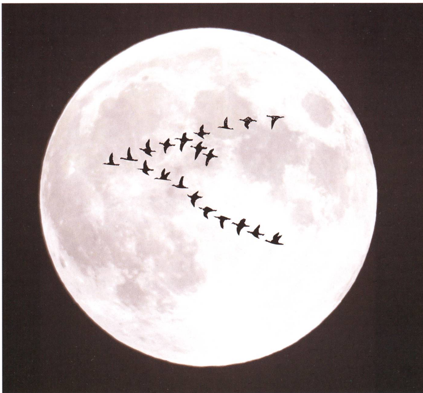
Wildgänse passieren die Mondscheibe im Formationsflug (Fotomontage).

Wenn die Tage wieder kürzer werden und die Sommertage gezählt sind, versammeln sie sich wieder auf Telefondrähten und Bäumen. Die Zugvögel bereiten sich auf ihre Reise in den Süden vor. Doch wie finden die Tiere überhaupt den Weg? Ist es eine Mär, dass sie sich nach Sonne, Mond und den Sternen orientieren?