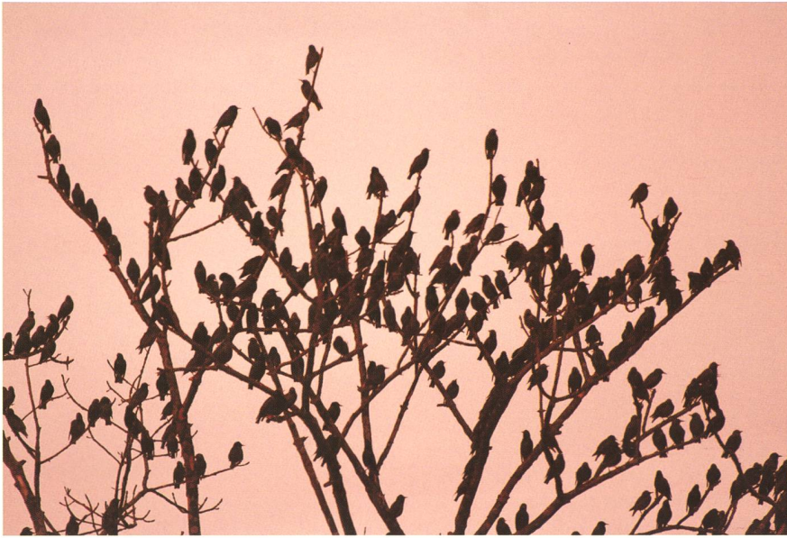
Hunderte von Staren versammeln sich im Herbst auf den Bäumen rund um das Neeracherried im Zürcher Unterland – ein Schauspiel, das viele Naturliebhaber und Vogelkundler ins Naturschutzgebiet lockt.