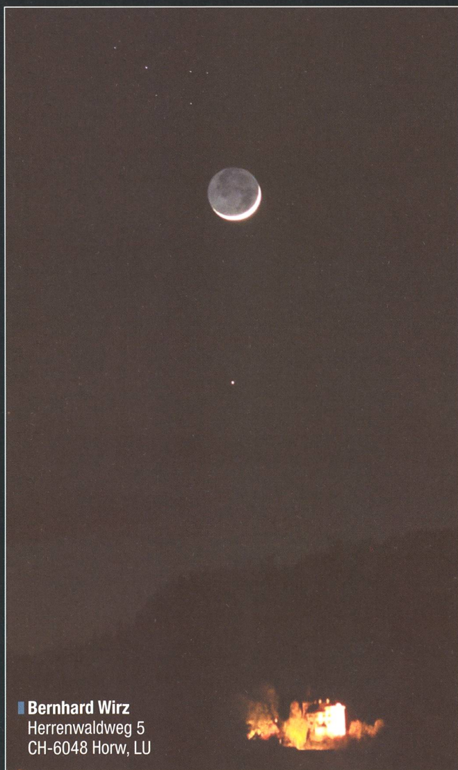
■ Bernhard Wirz Herrenwaldweg 5 CH-6048 Horw, LU

Je nachdem, wo man sich auf der Erde aufhält, sehen wir den Mond aus etwas unterschiedlichen Blickwinkeln. Da der Erdtrabant uns sehr nahe steht, hat er eine entsprechend grosse Parallaxe. So leuchtet ein, dass man in der Äquatorgegend und südlich davon noch eine ganze Weile länger in den Genuss von Plejadenbedeckungen kommt. Hierzu-lande müssen wir uns indessen bis 2024 gedulden.