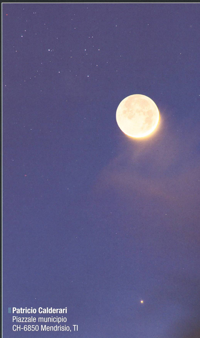
■ Patricio Calderari Piazzale municipio CH-6850 Mendrisio, TI