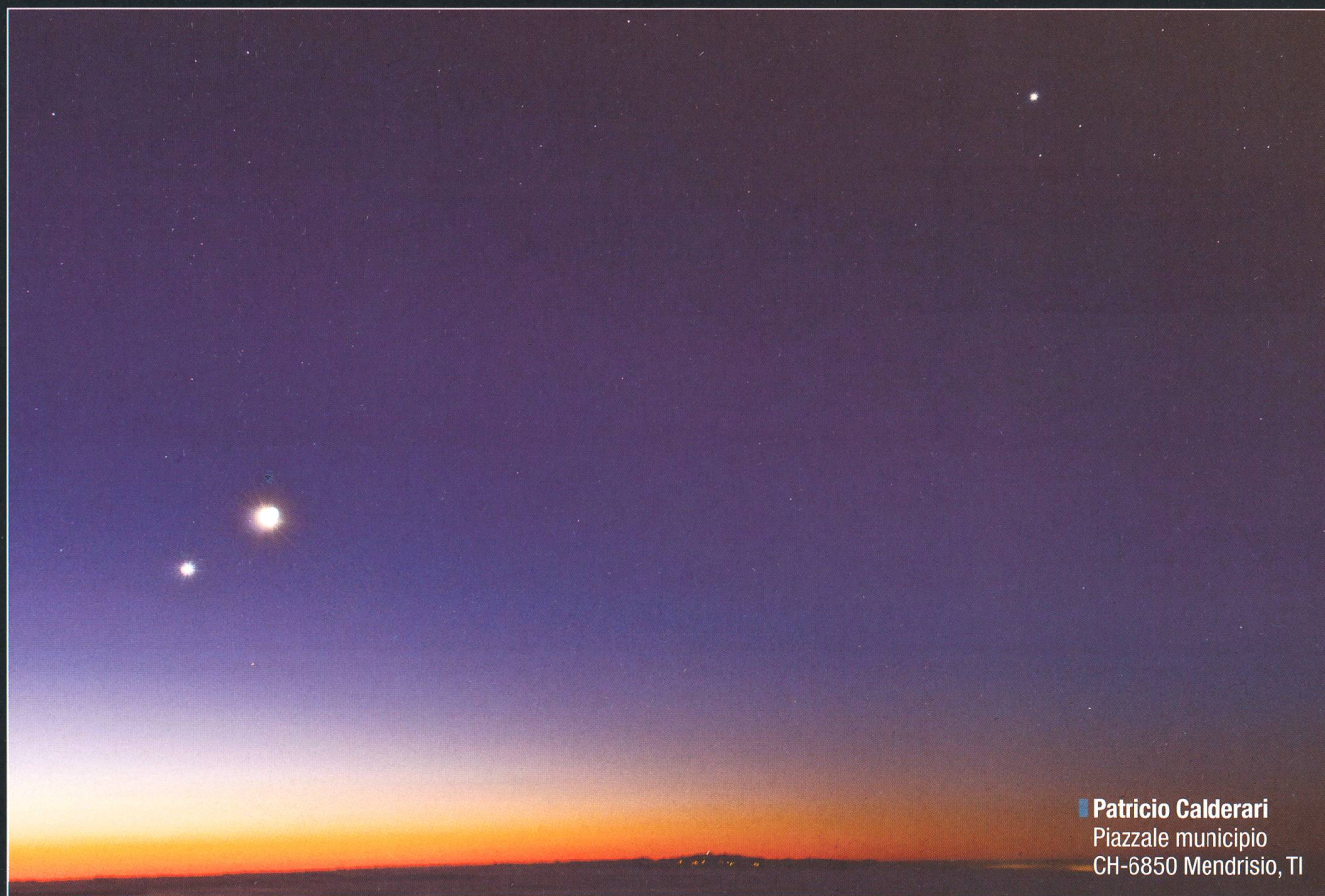
■ Patricio Calderari Piazzale municipio CH-6850 Mendrisio, TI