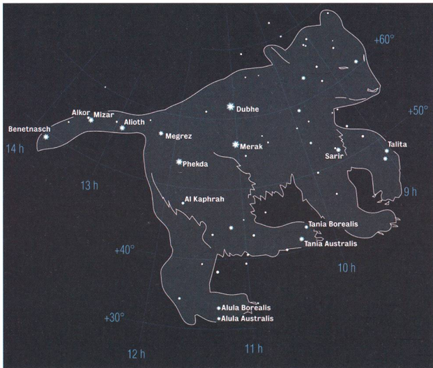
Früher wurden die Sternbilder figürlich dargestellt. Die häufig arabischen Sternnamen haben zumeist mit den Positionen der Sterne innerhalb des Sternbildes zu tun. (Grafik: Thomas Baer)

Wenn wir eine Sternkarte oder einen Sternkatalog aufschlagen, begegnen uns wohlklingende Namen wie Albireo, Cor Caroli, Beteigeuze und wie sie alle heissen. Doch wer benannte die funkelnden Himmelslichter? Was bedeuten ihre Bezeichnungen und wie wurde im Laufe der Jahrhunderte der Sternenhimmel systematisch erfasst?