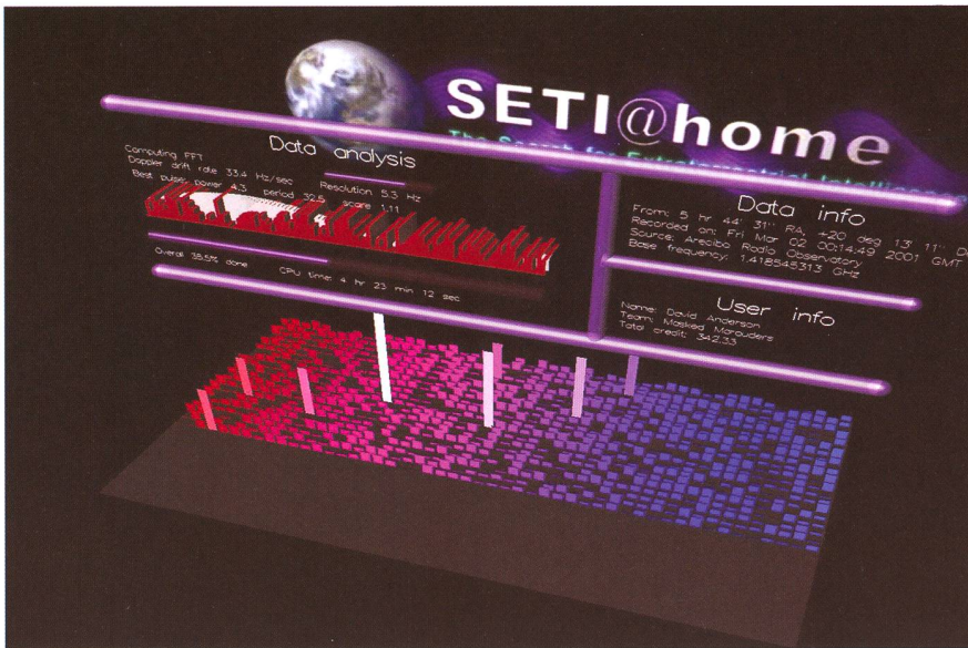
Was macht ein PC während einer Arbeitspause? Wer seinen Computer nicht mit dem Ausrechnen von Flugbahnen fliegender Kaffeetassen oder klappernder Toaster beleidigen will, kann während der ungenutzten Zeit seinen Rechner mit der Auswertung der in Arecibo gesammelten Daten beschäftigen. Den entsprechenden Bildschirm-schoner stellt SETI@home jedem Interessierten zur Verfügung. (Bild: SETI@home)

letzten paar Hundert Jahre der Wissenschaftsgeschichte, während denen die Erde und die Menschen ihre spezielle und zentrale Position in der Natur immer stärker verloren. Vermutungen und auch noch so vernünftige Überlegungen können gesicherte Erkenntnisse aber selbstverständlich nicht ersetzen. Und da der Nachweis anderer denkender Lebewesen im All wohl eine der wichtigsten Entdeckungen der Weltgeschichte wäre, mit unbekanntem Folgen für unser Selbstverständnis und unser Weltbild, für die Religionen und die Politik, so müssten eigentlich alle nur denkbaren Anstrengungen unternommen wer-