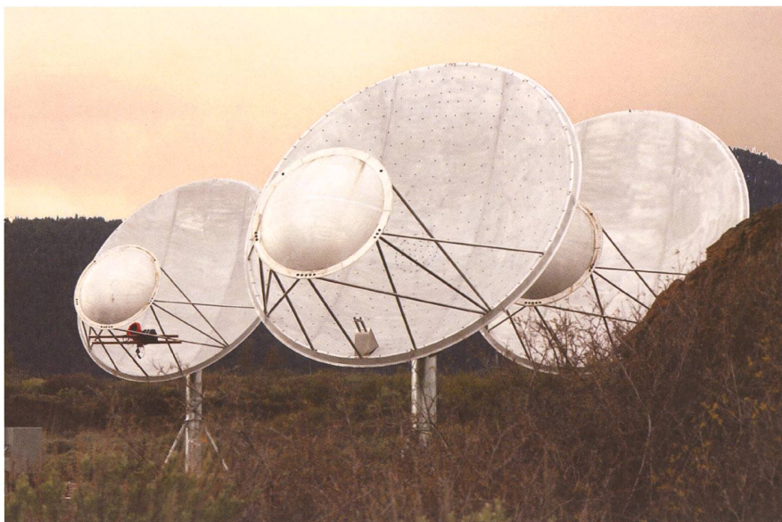
Das Allen Telescope Array in Nordkalifornien befindet sich im Bau. Nach seiner Fertigstellung wird es aus 350 einzelnen 6.1m-Antennen bestehen und das bisher einzige Grossteleskop sein, welches ausschliesslich für die SETI-Forschung zur Verfügung steht. Betrieben wird das Instrument vom privaten SETI-Institut und der Universität Berkeley.

mierte Harvard Universität mit ihrem Optical SETI – Programm, welches nach kurzen Lichtblitzen Ausschau hält die nicht natürlichen Ursprungs sein können.