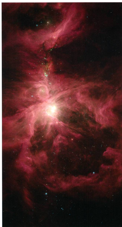
Infrarotbild des Orion-Nebels: Von Sternen erwärmter Staub leuchtet rot und orange, das Licht der Sterne blau, heisses Gas und Staub erscheinen grün.

Der vierthellste Stern im Trapez mit der Bezeichnung theta 1 Orionis B ist auch als Veränderlicher BM Orionis bekannt. Hinter diesem Namen verbirgt sich ein enges Sternenpaar aus einem B0V- und einem A7IV-Stern, das den gemeinsamen Schwerpunkt in 6,470533 Tagen umkreist. Auf Grund der günstigen Bahngeometrie kommt es für uns in regelmässigen Abständen zu gegenseitigen Bedeckungen, die sich als Lichtschwächung bemerkbar machen. Die gesamte Bedeckungsdauer des Hauptminimums beträgt 18,6 Stunden. Während dieser Zeit kommt es für 6,2 Stunden zu einer totalen Phase, in der das schwache Licht zumeist bei 8,52 mag verweilt, in der Mitte der Bedeckung aber um einige hundertstel Grössenklassen ansteigt. Zudem kann die Tiefe der Bedeckung minimal variieren. Im Normallicht strahlt das System mit 7,95 mag. Dem Gelegenheitsbeobachter wird dieser Unterschied nicht sogleich auffallen. Das Nebenminimum findet zur Hälfte der Periode statt, bringt jedoch, wie bei vie-