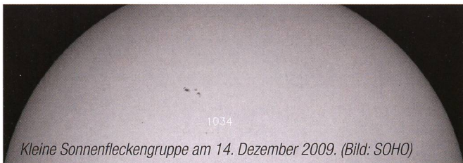
Kleine Sonnenfleckengruppe am 14. Dezember 2009.

■ Samstag, 17. und Sonntag, 18. April 2010 Einführungskurs in die Sonnenaktivitätsüberwachung Ort: Sternwarte Uecht bei Niedermuhlern BE Veranstalter: Rudolf Wolf Gesellschaft