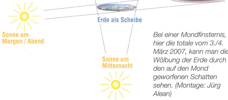
Abb. 3: Eigentlich hätten unsere Vorfahren merken müssen, dass eine scheibenförmige Erde nur um Mitternacht einen kreisrunden Schatten in den Raum werfen könnte. Kurz vor Sonnenauf- und nach Sonnenuntergang hätte dieser aber eine elliptische Form. (Grafik: Thomas Baer)

gar mit dem Flutberg vergleichen, indem man eine Anziehungskraft postuliert, die überall senkrecht nach oben wirkt und der das bewegliche Wasser stärker nachgibt als das Festland.