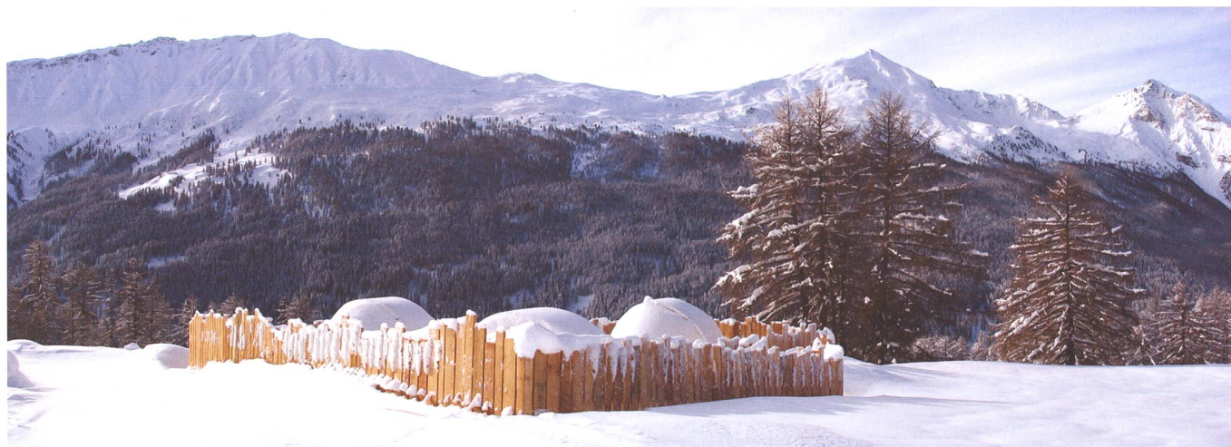
Wie Iglus ragen die Kuppeln des Astrovillage Lü-Steilas aus der tief verschneiten Winterlandschaft auf. Das Val Müstair zeichnet sich durch etwa 250 Sonnentage und 130-150 klare Nächte im Jahr aus und es gibt praktisch keine Luftverschmutzung.