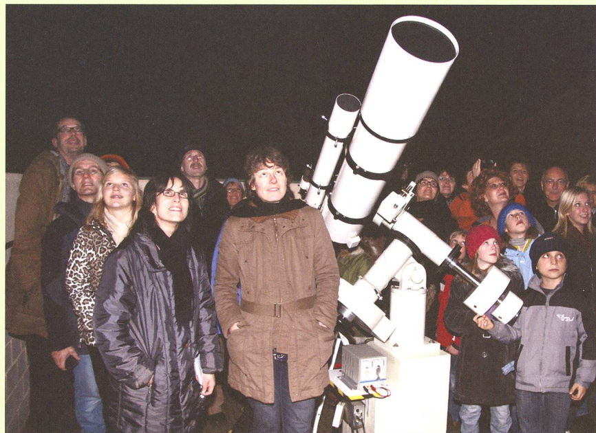
Viele öffentliche Sternwarten in der ganzen Schweiz öffnen am 24. April 2010 ihre Dächer und Kuppeln. Sofern das Wetter mitspielt, steht einem lehrreichen Sternabend nichts mehr im Wege.

sellschaft SAG wünscht allen Beteiligten schon jetzt gutes Gelingen und vor allem einen klaren Himmel. (tba)