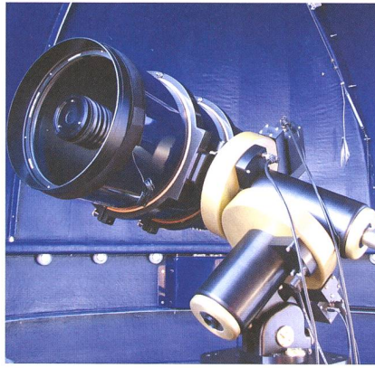
Das 14-Zoll-Meade-Teleskop in einer der Kuppeln.

Mit über 7000 km 2 ist Graubünden der grösste Kanton der Schweiz und mit 27 Bewohnern/km 2 gleichzeitig der am wenigsten bevölkerte. Bergregionen zeichnen sich durch offene Hochtäler aus, die einen weiten