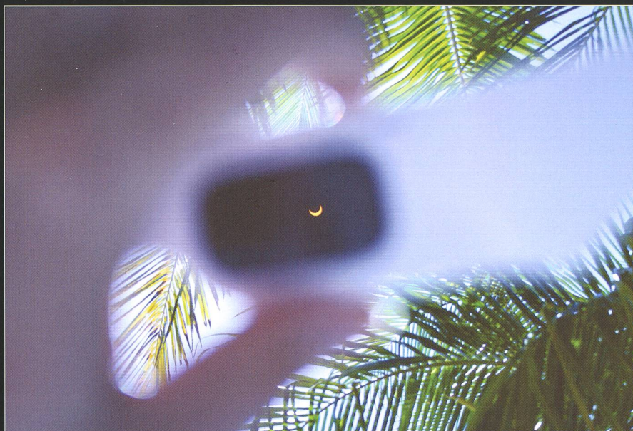
Die mitgebrachten Sonnenfinsternisbrillen waren begehrt. Durch sie konnten die Feriengäste und das Restaurantpersonal das himmlische Schauspiel gefahrlos verfolgen.

Sorgen bereitete uns eine aus Osten aufziehende dunkle Wolke, die sich der inzwischen schon schmal gewordenen Sonnensichel bedrohlich näherte und sich just auf den Beginn der Ringförmigkeit um 12:20 Uhr Lokalzeit anschickte, sich vor die bald den Neumond umarmende Sonne zu schieben. Über dem 15 Kilometer entfernten Malé, dem Dreh- und Angelpunkt der Malediven, schien sich ein Regenschauer gerade noch rechtzeitig zu verziehen. Welch ein Glück, dass sich die Wolken für einige Minuten von unserer