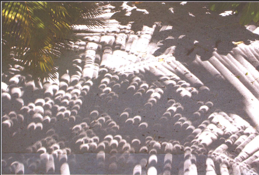
Hundertfach liessen sich die projizierten Sonnensicheln durch das Blätterwerk auf dem hellen Korallensandboden beobachten.

Kennen wir die Geschichte nicht bereits von früheren Erlebnissen dieser Art? Da ist es tagelang fast wolkenlos, doch als wolle der Wettergott die Finsternisfans ganz bewusst etwas necken, lässt er ausgerechnet am Tag des grossen Ereignisses gleich mehrere Cumulonimben in die Höhe wachsen. Schon am Morgen des 15. Januar 2010 zog ein Regenschauer über die östlich von «Thulhagiri» gelegenen Inseln Kanu und Kuda Huraa hinweg, der langsam Kurs auf Malé nahm. Nördlich unserer Insel braute sich nur wenig später ein zweites Schauergewitter zusammen,