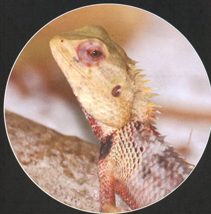
Auch die Schönechse freute sich, als die Sonne wieder zum Vorschein kam.

bilde. Interessant war auch zu beobachten, dass auf einmal ganz unterschiedliche Luftströmungen vorherrschten, gut zu sehen an den Wolkenrändern. Während sich die einen fast an Ort und Stelle zu formieren begannen, zogen die tiefer liegenden, angetrieben vom Nordostwind rasch weiter. Wieder andere drifteten in ganz verschiedene Richtungen.