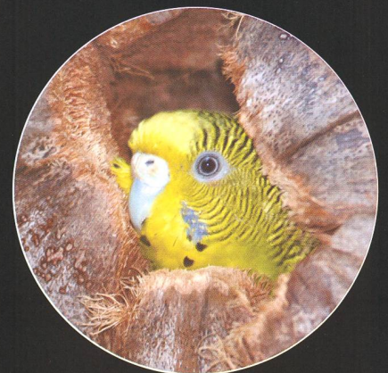
Etwas verängstigt guckt ein Kanarienvogel aus seiner «Kokosnusswohnung». Die sonst quirligen Vögel wurden auf einmal still.

Das Licht veränderte schon ab etwa der hälftig bedeckten Sonne auf seine ganz eigentümliche Weise. Irgendwie wirkte alles auf einmal viel klarer und dennoch diffus beleuchtet, so als würde man das Meer und die Landschaft durch eine graue Sonnenbrille betrachten. Allerdings adaptierte das Auge die Helligkeitsabnahme fortwährend, weshalb ich für die Landschaftsaufnahmen die Belichtungszeit automatisch vor Finsternisbeginn mass und anschliessend auf «manuell» umschaltete, damit die Blende den Helligkeitsverlust nicht bewusst korrigiert. Über den Lichtrückgang in den vier zusammengefügt Bildern (Seite 27 unten) bin ich dennoch überrascht. Vielleicht war die Wirkung deshalb stärker, weil die Sonne fast in Zenitnähe stand. Die