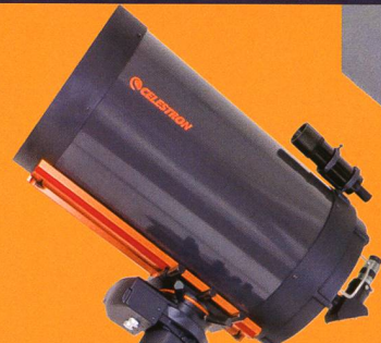
CGE Pro 1400

Maximale Tragfähigkeit bis 18 kg Ergonomische, einfache Ausrichtung der Montierung GoTo-Steuerung mit NexStar-Technologie, einfach in der Anwendung, kompatibel mit den meisten Planetariums-Software-Angeboten Neues «All-Star-Alignment» zum präzisen Einrichten ohne Polarstern und ohne Polsucher Die neue Software führt anstandslos nach bis 30° über den Meridian hinaus Ausgezeichnetes Preis-/Leistungsverhältnis