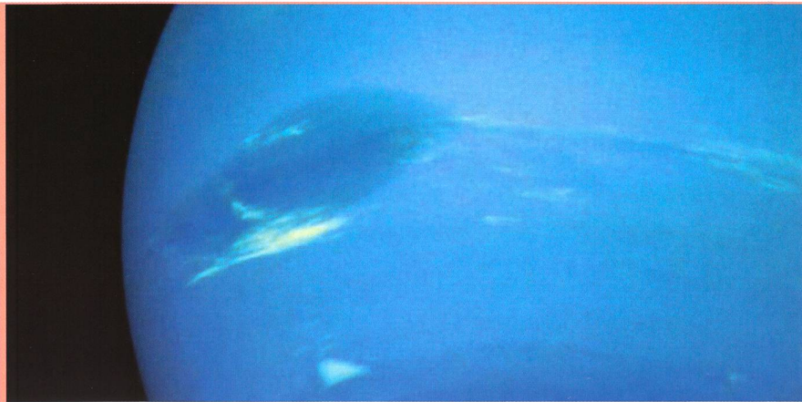
Bild: Vor zweihundert Jahren könnte ein Komet Neptun, den äussersten Planeten unseres Sonnensystems, getroffen haben..