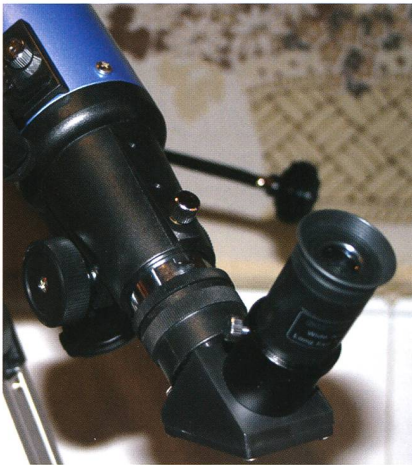
Fig. 2: Hier sehen wir den Okularauszug mit Umlenkprisma.

Ausrichtung der Optik in Zenitnähe stabil, selbst wenn die Fixierschraube nicht angezogen ist. Die Gängigkeit des Okularauszuges ist mit vier Andruckschrauben an der Unterseite justierbar. So kann sich jeder Beobachter die Gängigkeit je nach Vorlieben individuell einstellen. Sie war für meinen Geschmack werkseitig optimal eingestellt, zwar leichtgängig aber auch so stramm, dass der Fokus wie oben beschrieben stabil bleibt. Die Steckhülse für okularseitiges Zubehör, zum Beispiel Zenitspiegel, ist mit zwei Rändelschrauben zur Befestigung des Zubehörs versehen. Dies ist ein Vorteil gegenüber Geräten mit nur einer Schraube. Ein versehentliches Lösen und Herausfallen von Ausrüstungsgegenständen wird somit erheblich erschwert.