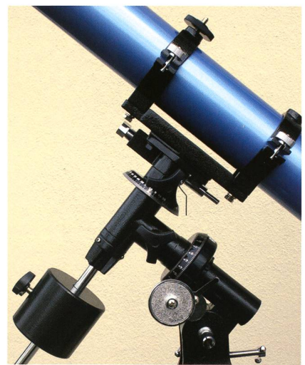
Fig. 4: die Montierung mit dem ca. acht Zentimeter dicken Tubus.

Die Stabilität der Montierung ist grenzwertig, aber akzeptabel. Eine exakte Fokussierung ist selbst bei 150-facher Vergrößerung möglich, erfordert im Hochvergrößerungsbereich jedoch etwas Fingerspitzengefühl. Die Montierung ist allerdings sehr schwingungs- und windanfällig. Eine maximale Stabilität wird erreicht, wenn die Optik exakt ausbalanciert wird. Das ist auch erforderlich, da ansonsten die Nachführung in Rektaszension versagt. Bei einer genauen Ausbalancierung läuft die Nachführung bei meinem Exemplar butterweich.