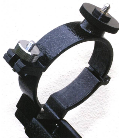
Fig. 3: Die Abbildung zeigt eine der beiden Rohrschellen.

Die Rohrschellen sind sehr hochwertig verarbeitet. Sie sind aus Metall und nicht aus Filzeinlage. Wenn man die Verschlüsse leicht aufdreht, lässt sich der Tubus zum Ausbalancieren leicht und ruckelfrei verschieben. Es genügt ein nicht zu strammes Anziehen der Feststellschrauben, um die volle Stabilität zu erreichen. Sollte ich das Teleskop später auf eine stärkere Montierung setzen,