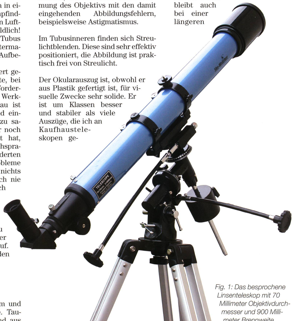
Fig. 1: Das besprochene Linsenteleskop mit 70 Millimeter Objektivdurchmesser und 900 Millimeter Brennweite.

sehen habe. Es zeigt sich minimales Spiel, das sich jedoch in der praktischen Beobachtung nicht bemerkbar macht. Insgesamt scheint der Okularauszug trotz des Materials gewissenhaft konstruiert zu sein: Ein einmal eingestellter Fokus bleibt auch bei einer längeren