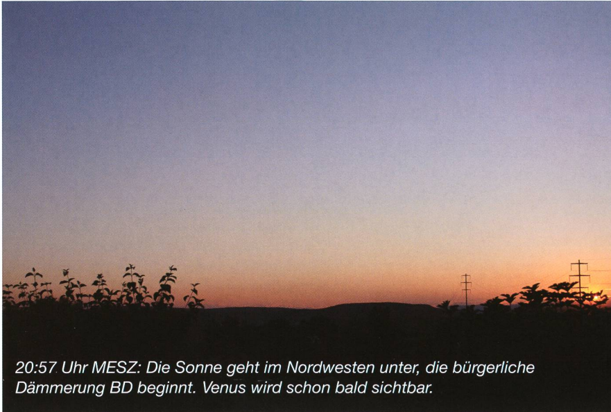
20:57 Uhr MESZ: Die Sonne geht im Nordwesten unter, die bürgerliche Dämmerung BD beginnt. Venus wird schon bald sichtbar.