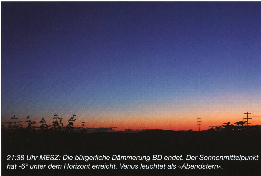
21:38 Uhr MESZ: Die bürgerliche Dämmerung BD endet. Der Sonnenmittelpunkt hat -6^\circ unter dem Horizont erreicht. Venus leuchtet als «Abendstern».