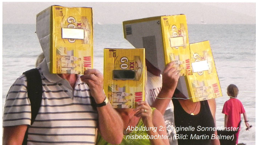
Abbildung 2: Originelle Sonnenfinsternisbeobachter.

Sandstrand. Der Platz war ideal, denn hier konnte uns niemand die freie Sicht verhindern. Um 05:40 Uhr fand ein Sonnenaufgang wie im Bilderbuche statt. Die leichte Bewölkung wurde immer noch mehr als Bereicherung für stimmungsvolle Bilder denn als Bedrohung empfunden. Die nun deutlich angeschnittene Sonnenscheibe zeigte sich immer wieder zwischen dekorativen Wolkenpaketen. Da und dort waren aber am Horizont dunklere Schauerzonen auszumachen. Punkt 06:38 Uhr begann die Tota-