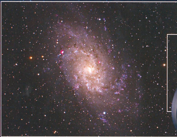
M33 - Spiral Galaxie (Ausschnitt) Aufgenommen mit CGE Pro 1400 HD und Nightscapé (abgebildet).