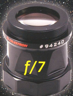
Bildgeebneter Reducer 0,7x, leuchtet auch Vollformat vignettierungsfrei aus. Lieferbar für EdgeHD1100 und 1400.

Fotografieren Sie Deep-Sky-Objekte im Primärfokus mit einer CCD- oder DSLR-Kamera und dem EdgeHD T-Adapter, oder Planeten mit der neuen NexImage 5 Kamera und einer der neuen 2x oder 3x X-Cel Barlow-Linsen.