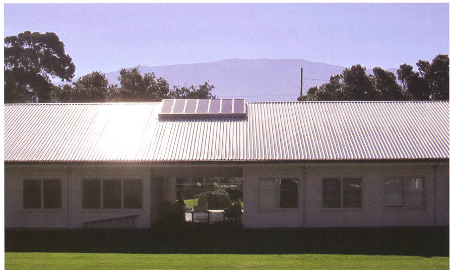
Abbildung 4: Das Visiting Scientist Quarters (VSQ), wo sich der Kontrollraum befindet. Im Hintergrund sieht man den Mauna Kea (4200 m) mit verschiedenen Teleskopen, unter anderem das Keck Observatorium.