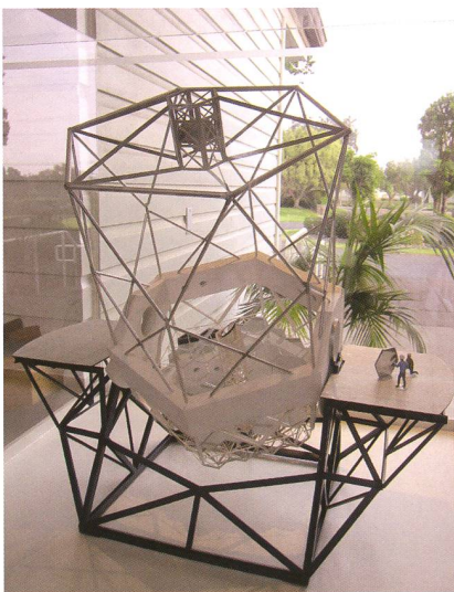
Abbildung 3: Modell des Keck-Teleskops, das einen Spiegeldurchmesser von 10.4 m hat.

Um das Spektrum einer Galaxie aufzuzeichnen, muss das Licht durch einen Spalt fallen. Bei MOSFIRE kann man 46 Spalte zu gleich einstellen, das heißt, man kann bis zu 46 Galaxien gleichzeitig beobachten. Eine Konfiguration mit den 46 Spalten nennt man Maske, welche roboterhaft via Computer eingestellt werden kann. Diese sogenannte