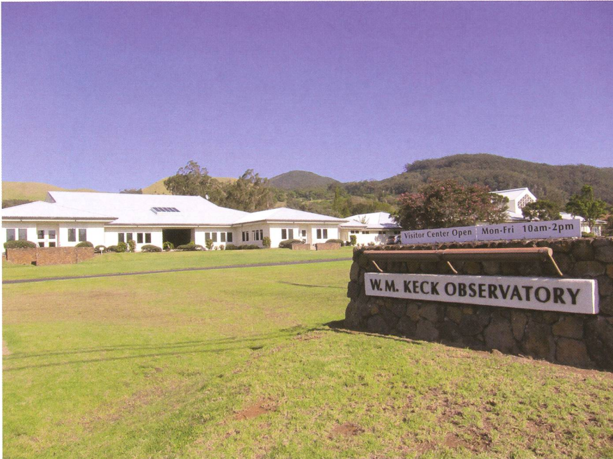
Abbildung 2: Das Visiting Scientist Quarters (VSQ) und Besucherzentrum in Waimea, im Nordwesten von Big Island, liegt idyllisch im Tal des Waikōloa Stream.

ren kann. Die Idee unseres Versuchs war es, das Spektrum von weit entfernten – d. h. weit in der Vergangenheit liegenden – Galaxien zu messen. Kürzlich hat eine Forschungsgruppe in den USA behauptet, eine Galaxie mit einer Rotverschiebung von z = 12 entdeckt zu haben ( http://arxiv.org/abs/1211.6804 ). Dieser Wert deutet darauf hin, dass die Galaxie nur etwa 400'000 Jahre nach dem Urknall entstanden ist und somit eine der ersten in unserem Universum wäre. Die Forscher haben die sogenannte Lyman-Break-