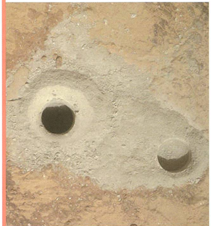
Bild: In der Bildmitte ist das erste Bohrloch auf Mars zu sehen, aus dem Gesteinsproben entnommen wurden. Rechts ist ein rund zwei Zentimeter tiefes Loch zu sehen, dass zuvor testweise gebohrt wurde.

Mit dem an seinem Roboterarm angebrachten Bohrer PADS (Powder Acquisition Drill System) habe der Marsrover ein 1,6 cm breites und 6,4 cm tiefes Loch in einen Stein gebohrt, teilte die US-Raumfahrtbehörde NASA mit. Das Gestein soll auf Spuren von Wasser untersucht werden. «Curiosity» war am 6. August 2012 nach einer mehr als acht Monate langen Reise auf dem Mars gelandet. Der Roboter soll mit Hilfe seiner insgesamt 75 kg schweren Bordapparaturen nach Spuren von Leben suchen und klären, ob der Mars für Mikroorganismen geeignet ist. (aba)