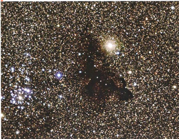
Bild: Der helle Sternhaufen NGC 6520 und die seltsam geformte Dunkelwolke Barnard 86.

Das mit dem Wide Field Imager am MPG/ESO 2,2-Meter-Teleskop am La Silla-Observatorium der ESO in Chile aufgenommene Bild zeigt den hellen Sternhaufen NGC 6520 und seine seltsame Nachbarin, die an die Silhouette eines Geckos erinnernde Dunkelwolke Barnard 86. Wir sehen dieses kosmische Paar vor einem Hintergrund aus Millionen leuchtender Sterne im hellsten Teil der Milchstrasse. Tatsächlich sind die