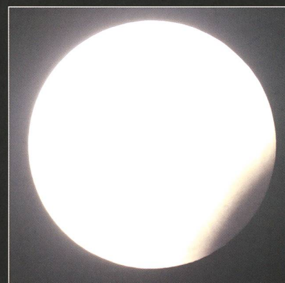
Abbildung 4: Die längere Belichtung lässt nun den Kernschatten und dessen unscharfen Rand erkennen.

Will man gegen 22:07.5 Uhr MESZ die kleine Delle des Kernschattens abbilden, kann man die Belichtungszeit manuell verlängern. Abb. 4 wurde \frac{1}{10} s lang durch dünne Zirruswolken hindurch belichtet. Jetzt erscheint die Mondscheibe, da überbelichtet, ausgebrannt, sprich, die Oberflächendetails (Maria und Krater) verschwinden. Dafür werden die leicht bräunliche Färbung des Kernschattens und dessen Randunschärfe sichtbar. (tba)