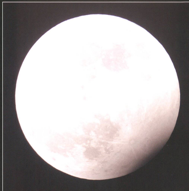
Abbildung 2: Auch die partielle Mondfinsternis am Silvesterabend 2009 fiel sehr klein aus. In der obigen Aufnahme steht der Vollmond weniger als 2% im Kernschatten der Erde und bietet somit etwa den Anblick, wie wir ihn am 25. April 2013 gegen 22:07 Uhr MESZ erwarten dürfen.

Wer schon einer Mondfinsternis teleskopisch beigewohnt hat, weiss, wie schwierig es ist, den Beginn der partiellen Phase zu registrieren.