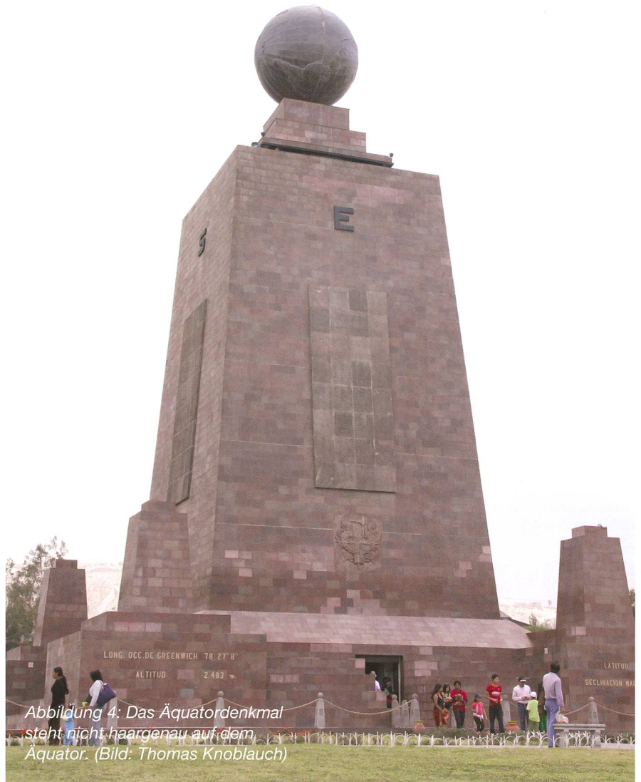
Abbildung 4: Das Äquatordenkmal steht nicht haargenau auf dem Äquator.

Auf dem 2638 m hohen Berg Catequilla (Koordinaten: 0° 0' 0.0" Nord und 78° 25' 42.2" West) wurde in den 1990er-Jahren eine Landstruktur entdeckt, welche der vor-columbianischen Ära de Quitu-Cara zugeordnet wird. Leider ist wenig über diese 1000-jährige Kultur (welche vor den Inkas war) bekannt, jedoch wird wegen der genauen Lage auf dem Äquator ein astronomischer Zusam-