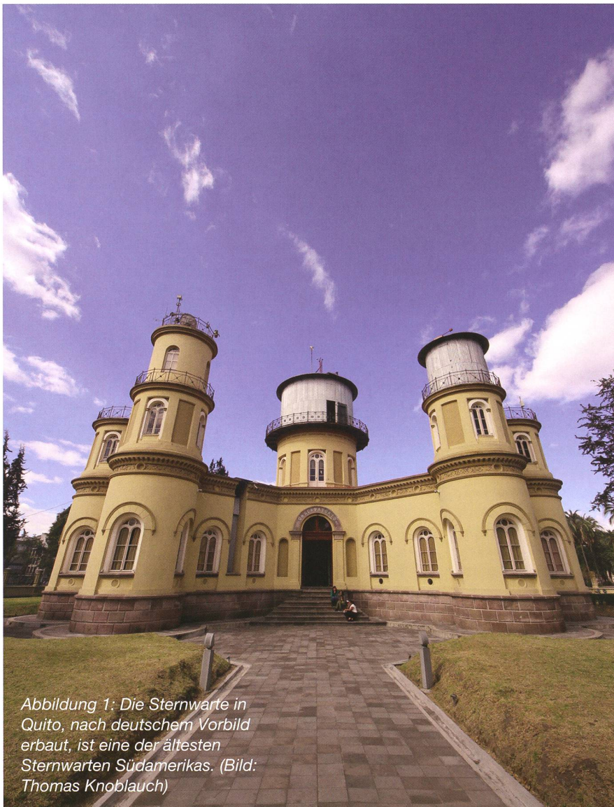
Abbildung 1: Die Sternwarte in Quito, nach deutschem Vorbild erbaut, ist eine der ältesten Sternwarten Südamerikas.

Heute erstrahlt die im 2009 renovierte Sternwarte in vollem Glanz. Sie beherbergt ein astronomisches Museum, wo zahlreiche historische Geräte ausgestellt sind.