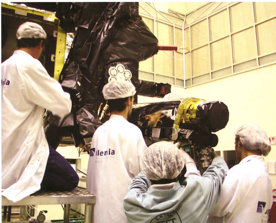
Abbildung 1: Einbau von ROSINA (Rosetta Orbiter Spectrometer for Ion and Neutral Analysis) und des Flugzeitmassenspektrometers RTOF (Reflectron time-of-flight) in Rosetta beim ESTEC (European Space Research and Technology Centre).

Am 2. März 2004 startete eine Ariane V Rakete von französisch-Guyana aus mit grossem Getöse in den wolkenverhangenen Nachthimmel. Damit begann die lange Reise der europäischen Kometenmission Rosetta zum Zielkometen Churyumov-Gerasimenko, eine Reise durchs All und gleichzeitig eine Reise zurück zu unserem Ursprung. Wir Berner Forscher nahmen mit einem lachenden und einem weinenden Auge Abschied von unserer ROSINA (Rosetta Orbiter Sensor for