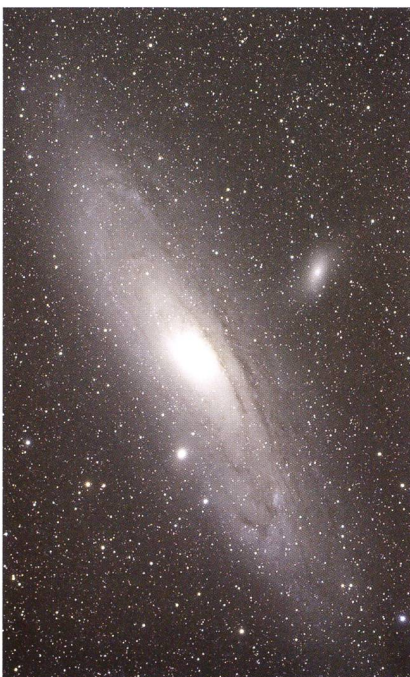
Abbildung 3: M 31, nur 3x10 min belichtet mit unmodifizierter Canon 450D am Pentax 75SDHF und 0.72-Reducer.