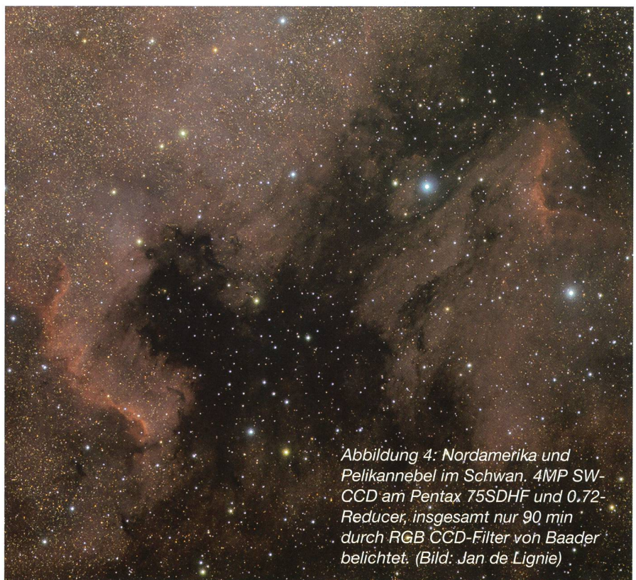
Abbildung 4: Nordamerika und Pelikannebel im Schwan, 4MP SW-CCD am Pentax 75SDHF und 0.72-Reducer, insgesamt nur 90 min durch RGB CCD-Filter von Baader belichtet.