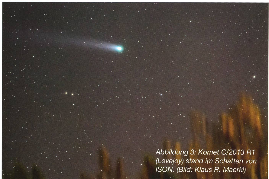
Abbildung 3: Komet C/2013 R1 (Lovejoy) stand im Schatten von ISON.

■ Klaus R. Maerki Eggenbergstrasse 2 CH-8127 Forch