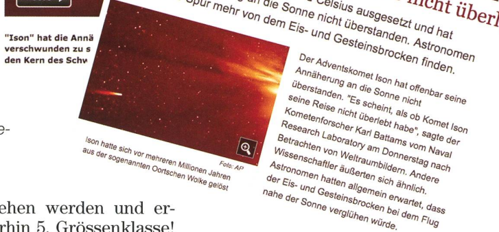
Abbildung 2: Schon vor dem Perihel verkündeten einige Online-Plattformen das Ende des Kometen. (Foto: Printscreen)

ISON narrete uns immer wieder. Im Frühjahr stagnierte seine Helligkeit, ab August wollte er dann irgendwie nicht richtig in Fahrt kommen, ehe er am 13. November 2013 in nur 24 Stunden dank eines Helligkeitsausbruchs plötzlich um zwei Helligkeitsklassen anstieg. Kurz vor seinem Perihel gelangten dann doch recht ansprechende Bilder des Kometen. Doch selbst jetzt war ISON weit von einem spektakulären Schweifstern entfernt und konnte in dieser Phase nicht einmal dem Frühlingskometen Pan-STARRS das Wasser reichen! Und als sich das Objekt in den hellen Bereich der Sonne zurückzog, spielte sich das eingangs Geschilderte ab.