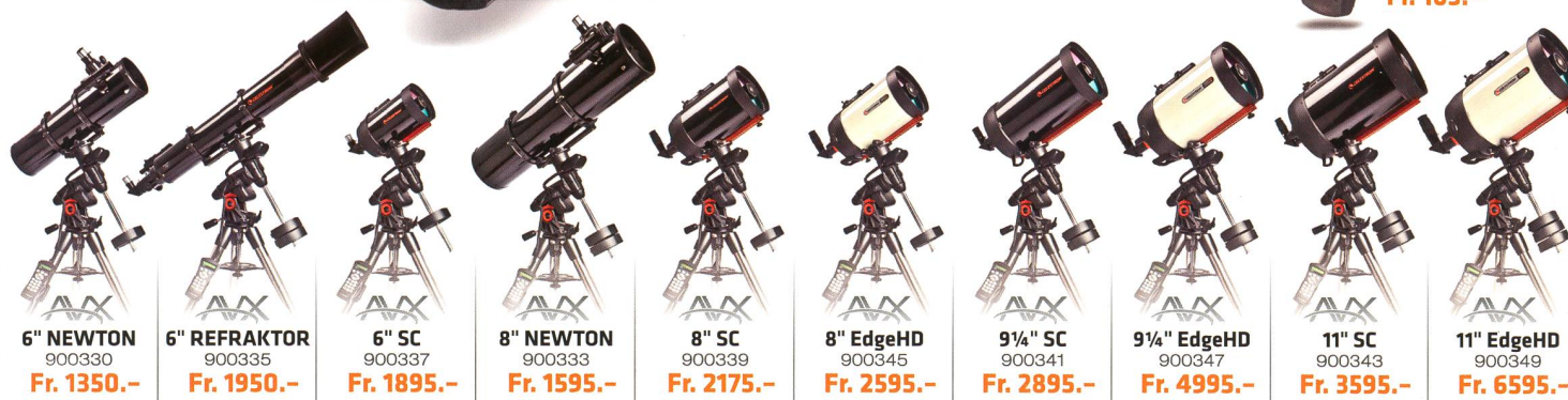
6" NEWTON 900330 Fr. 1350.-