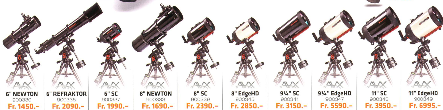
6" NEWTON 900330 Fr. 1450.-