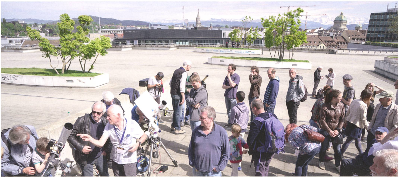
Abbildung 2: Dachterasse mit Bern im Hintergrund: Das ExWi ist ideal gelegen oberhalb des Bahnhofs. Mit dem Bundeshaus und dem Münster im Hintergrund sowie dem unverkennbaren Bergpanorama von Bern war das Warten kurzweilig.

wortlich ist. Wie bei Rosetta müssen wir uns aber nach dem Start noch in Geduld üben: Erste Bilder gibt es frühestens ab 2024. Besonders spannend wird das Ende der langen Reise. Ein schwieriges Bremsmanöver steht der Sonde be-