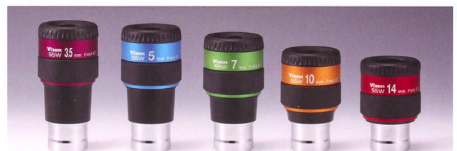
NEU: Vixen Okulare SSW 83° Ø 1 1/4", 31.7mm

Bildschärfe: Extrem scharfe Sternabbildungen über das gesamte Gesichtsfeld. Helligkeit: «High Transmission Multi-Coating»-Vergütung* auf allen Luft-Luft-Linsenoberflächen in Kombination einer Spezialvergütung auf den Verbindungsoberflächen zwischen den Linsen, liefern einen extrem hohen Kontrast und ein sehr helles Sehfeld.