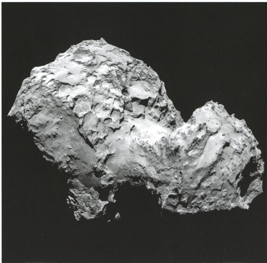
Abbildung 2: Deutlich ist auf dieser Aufnahme vom 2. August 2014 der «Hals» des Kometen 67P/Churyumov-Gerasimenko zu sehen.