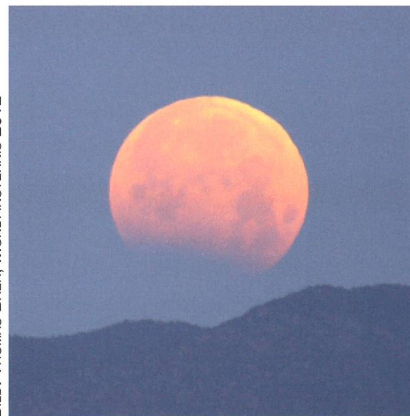
MONDFINSTERNIS 2012

Auch im Sommer zeigt sich Merkur in der langen Abenddämmerung.