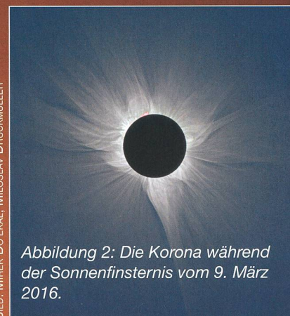
Abbildung 2: Die Korona während der Sonnenfinsternis vom 9. März 2016.