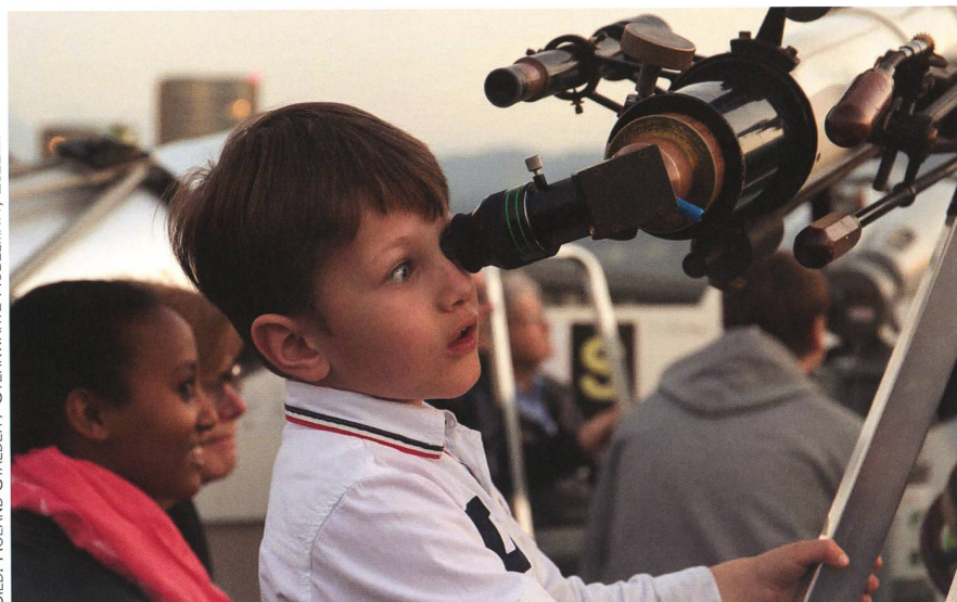
Abbildung 4: Dieser Junge hat den Merkur in der abendlichen Dämmerung erspäht.

be Verhältnisse. Rechtzeitig auf den Astronomietag hin war die Sicht auf den Himmel dann weitgehend klar. In der Sternwarte Hubelmatt und in den Räumlichkeiten des gleichnamigen Schulhauses bot das Team der Astronomischen Gesellschaft Luzern AGL dem Publikum wie gewohnt ein attraktives Programm mit interessanten Vorträgen, Beobachtungen, Informationstafeln und Modellen.