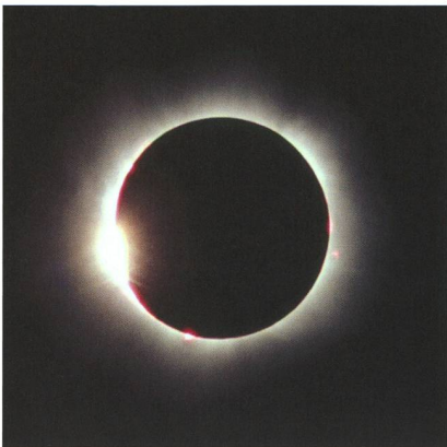
Abbildung 2: Totale Sonnenfinsternis 1999 über Ungarn. Soeben erlischt der letzte Sonnenstrahl um 12:46.9 Uhr MESZ am linken Mondrand. Die Korona taucht auf!