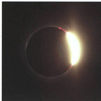
Abbildung 4: Der 3. Kontakt war um einiges imposanter als der zweite. Wie weissglühendes Metall quoll die Sonne um 12:49.1 Uhr MESZ wieder hinter dem Mondrand hervor.

rallinie stehen, denn keine 3 km vom Rand entfernt ist die «schwarze Sonne» schon während einer Minute zu sehen! Columbia und Jefferson City (Missouri) sind die beiden nächsten Stationen, über denen das Tagesgestirn erlischt. St. Louis am Mississippi liegt am Nordrand des Totalitätsstreifens und wird, ähnlich wie Kansas City, halbiert. Wer also Pech hat, sieht die Korona knapp nicht mehr, während man im südlichen Teil der Stadt das unvergessliche Schauspiel bis zu 2 min lang geniessen kann.