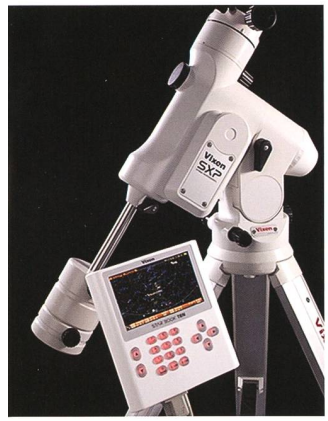
Parallaktische Montierung SXP mit Starbook TEN