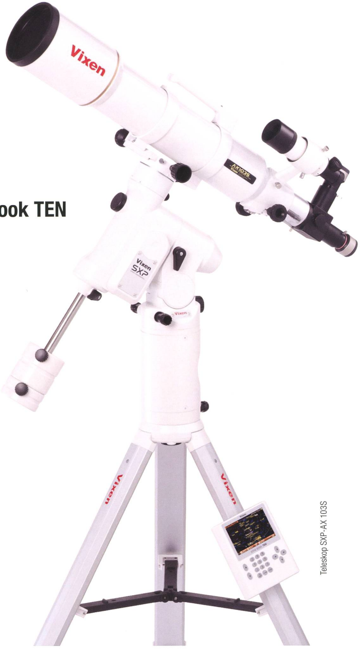
Teleskop SXP-AX 103S

VIXEN Fernrohr-Optiken: Achromatische Refraktoren – Apochromatische Refraktoren – Maksutov Cassegrain – Catadioptrische Systeme VISAC – Newton Reflektoren.