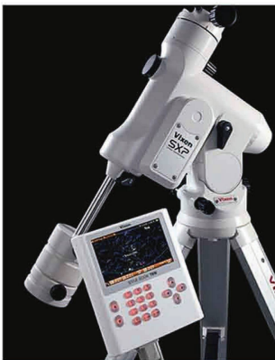
Parallaktische Montierung SXP mit Starbook TEN